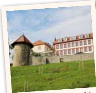
Blick vom Radweg auf das Schlossensemble in Geisa

Während des kalten Krieges war Geisa die am weitesten westlich gelegene Stadt des Ostblocks und lag mitten im Sperrgebiet. Wie sich das Leben an der Grenze im Laufe ihres Bestehens entwickelte und die nahe bei Geisa stationierten Amerikaner die Stadt sahen, erfahren Sie am Standpunkt in Geisa. Unbedingt lohnenswert ist der Besuch der historischen Altstadt mit zahlreichen Sehenswürdigkeiten und gastronomischen Angeboten.