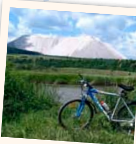
Die weißen Berge

Der ehemalige Grenzort Unterbreizbach mit rund 3.600 Einwohnern lebt seit Jahrzehnten mit und vom Kali-Bergbau, der die Region seit über 100 Jahren prägt. Ihm verdankt auch der nahe gelegene Monte Kali seine Entstehung. Woraus der weiße Berg besteht und warum er täglich größer wird, erfahren Sie am Standort.