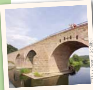
Brücke der Einheit

Im Werratal, direkt in Nachbarschaft zur Rhön und dem Thüringer Wald, liegen die ehemalige Grenzstadt Vacha und die historische Burg Wendelstein. Vielseitige kulturelle Veranstaltungen und die reizvolle Umgebung machen die Stadt attraktiv und laden zu einem Besuch ein.