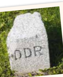
Grenzstein der DDR