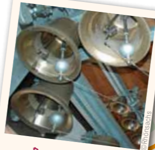
Bronzeglocken des Carillons

Als „klingender Kirchturm“ ist die Stadtpfarrkirche St. Philippus und Jakobus zu Geisa bekannt. Seit 2003 können Besucher die 49 handgegossenen Bronzeglocken des Carillons erklingen hören oder im Rahmen einer Führung sogar hautnah erleben.