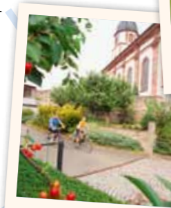
Dorfkirche „Maria Schnee“

Nachdem sich Schleid jahrzehntelang im Sperrgebiet befand und für Touristen unzugänglich war, kann heute die barocke Dorfkirche „Maria Schnee“ wieder besichtigt werden. Nach der Patronin der Pfarrkirche ist das „Schneefest“ benannt, welches seinen Ursprung zu Zeiten des Dreißigjährigen Krieges hat. Wie und warum das regional bekannte Fest heute noch gefeiert wird und sich das kirchliche Leben im Grenzgebiet zu Zeiten des SED-Regimes gestaltete, erfahren Sie am Standort Schleid.